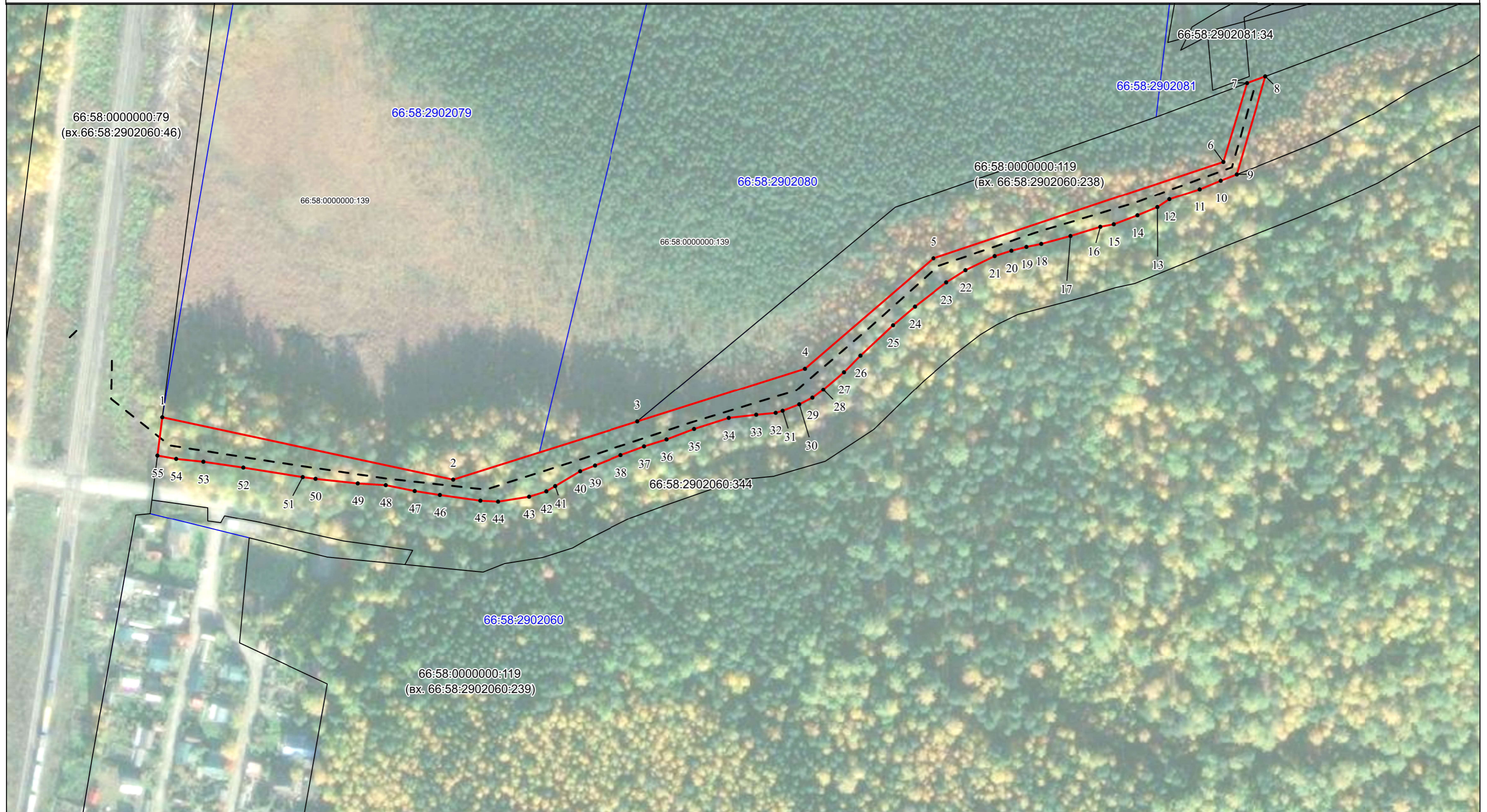
Схема расположения границ публичного сервитута на кадастровом плане территории