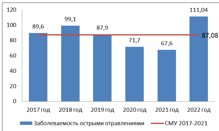
Рис. №1 Динамика уровня заболеваемости острыми отравлениями в быту среди населения ГО Первоуральск в 2017-2022 гг. (в показателях на 100 тыс. населения)

За 2022 год на территории ГО Первоуральск зарегистрировано 169 случаев отравлений в быту (111,04 на 100 тыс. населения), что выше уровня отравлений за аналогичный период 2021 года (104 случая, показатель – 67,6 на 100 тыс. населения) на 64,3% и выше СМУ (показатель 87,08 на 100 тыс. населения) на 27,5% .