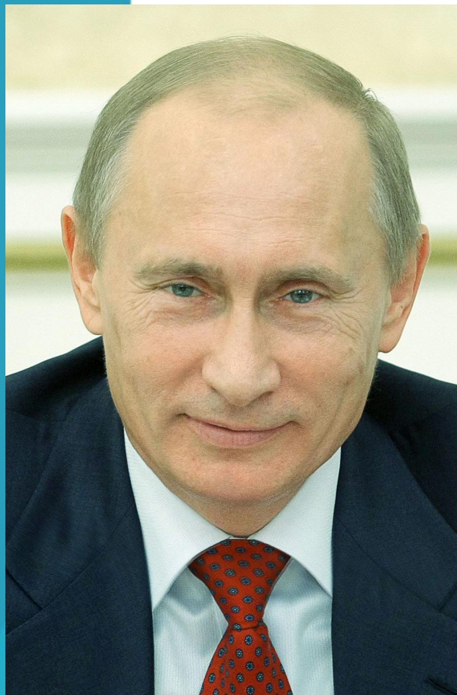
Президент Российской Федерации