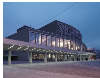
Дворец молодежи – инклюзивный кинопоказ, Педагоги России