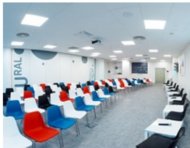
Точка кипения – женский потенциал социальной сферы калейдоскоп компетенций и образование нового типа