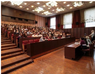
Уральский институт управления РАНХиГС – ценности, пересечения и разность поколений

Пространством СОЦИО станет весь г. Екатеринбург, его площадки, фокусирующие различные тематические направления: