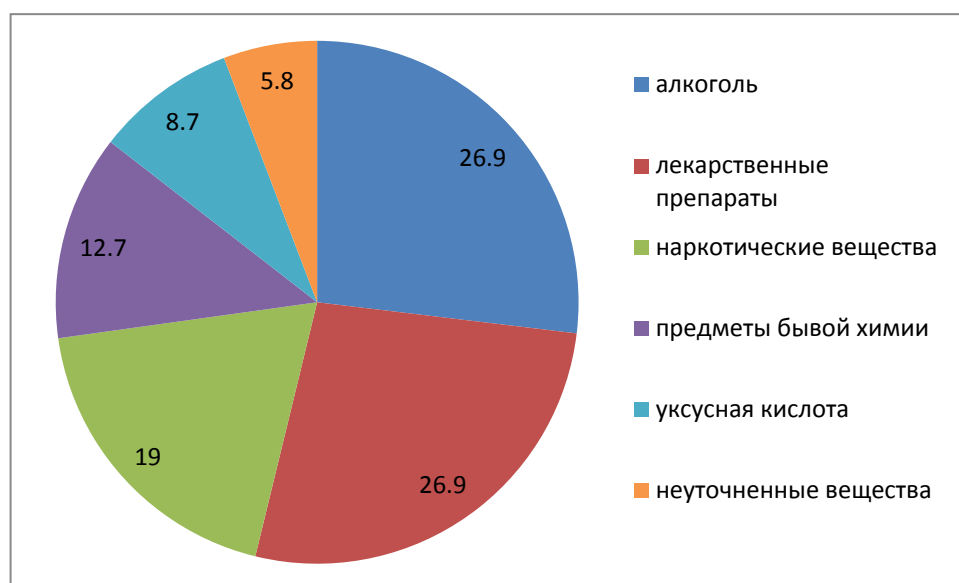
Рис. №2. Структура заболеваемости острыми бытовыми отравлениями среди жителей МО Первоуральск за 2024 год

За 2024 год зарегистрировано 34 случая отравлений алкоголем (26,9%), 34 случая – отравлений лекарственными препаратами (26,9%), 24 случая - отравления наркотическими веществами (19,0%), 16 случаев - отравления предметами бытовой химии и газами (12,7%), 11 случаев – отравление уксусной кислотой (8,7%), 7 случаев – отравления неуточненными веществами (5,8%).